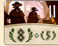
II 시대 전염병 의사 5개