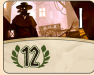
I 시대 전염병 의사 5개