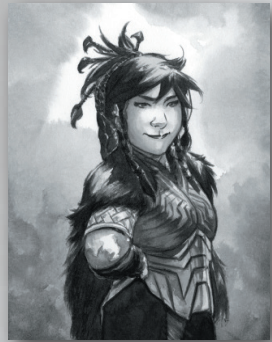
'예측할 수 없는 자' 위르드

군대 평가 직전에, 카드가 가장 적게 놓인 직업 열에 놓습니다. 해당하는 직업 열이 여러 곳이라면, 무작위로 결정합니다. 위르드는 게임이 끝날 때까지 그 자리에 그대로 남아 있습니다.